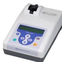
GENE LIGHT GL-220A